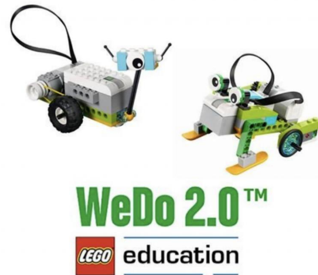
«Lego WEDO 2.0»